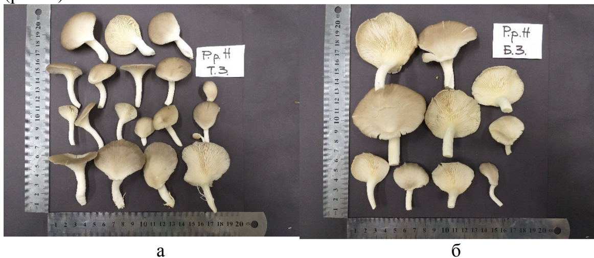
Рис. 2. Стадії морфогенезу плодових тіл штаму Pleurotus pulmonarius 2314 (а – технологічна; б – біологічна зрілість) за температури 24-26°C на фазі плодоношення

Морфологічний розвиток базидіом штаму гливи легеневої 2314 за умов досліду відбувався протягом 16-24 годин від стадії примордіїв (розмір 2-3 мм) до стадії біологічної зрілості (початку спороношення) (рис. 2).