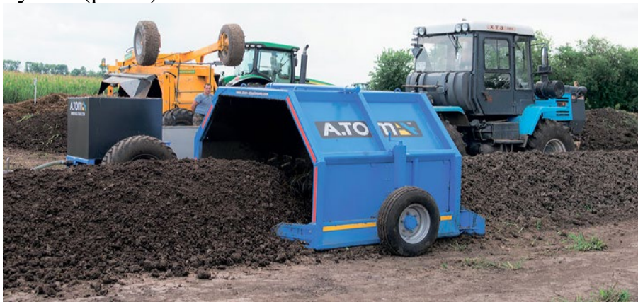
Рисунок 4. Приклад причіпного аератора

На первинних етапах це використання матеріалу для компосту, який не викликає появу патогенів. Під час процесу компостування заходами для знищення патогенів є регулювання температури та вологості, а також регулярне перемішування та насичення киснем. Для насичення киснем компосту використовують так звані аератори, або перемішувачі (рис.4).