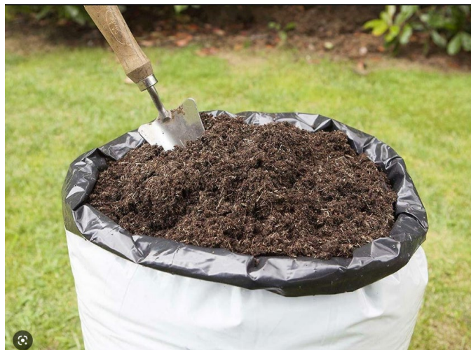
Рисунок 1. Готовий компост

Основна частина. Компостування – це метод який дозволяє отримувати органічні добрива з відходів (викидів). Існує дуже багато методів компостування, які відрізняються складом мінеральних домішок, органічних матеріалів, способами дотримання необхідної вологості, температури та доступу кисню, а також підвищення вмісту необхідних мікробіологічних речовин. Компост застосовується як ефективне добриво під будь-які види сільськогосподарських рослин, а у садівництві для підживлення плодових дерев. Економічно вигідно його застосовувати на місці де його виготовляють. Готовий компост (рис.1), що зброджувався у термофільних та мезофільних умовах, буде сприяти розмноженню дощових черв'яків, діяльність яких є корисною для рослин. Компост покращує структуру ґрунту [7,8].