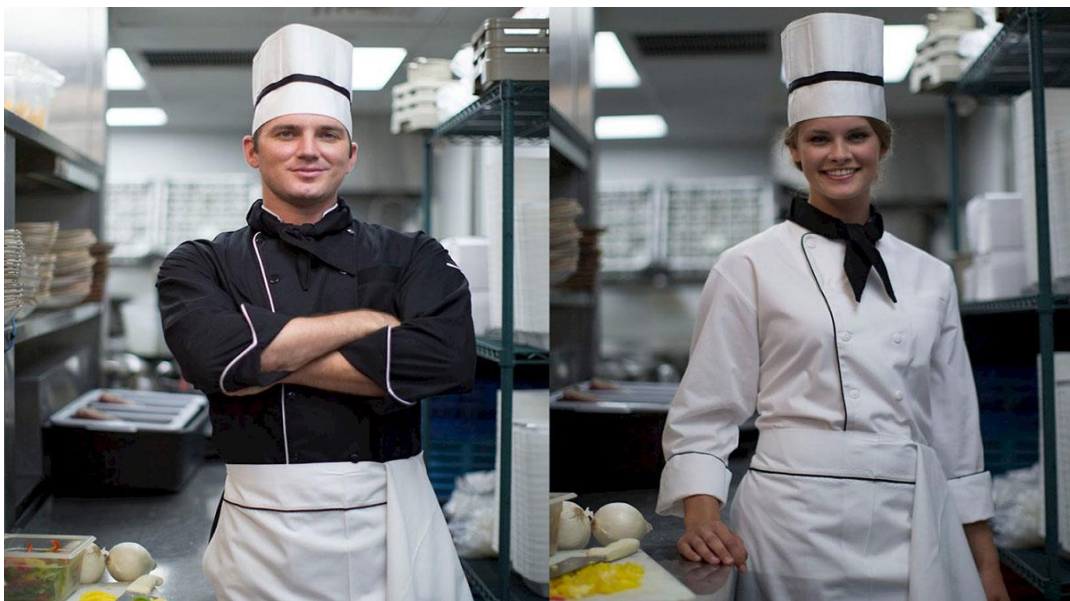
Рис. 2. Сучасний кухарський одяг

Сучасний кухарський одяг представлено на рис. 2.