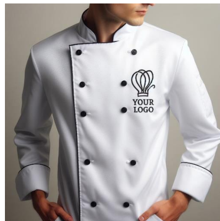
Рис. 3. Сучасне брендування кухарського одягу

Згідно з нормами, кухарові видається три комплекти одягу в рік. При необхідності норма видачі спецодягу може збільшуватися, що має бути закріплено в колективному договорі між роботодавцем і працівниками.