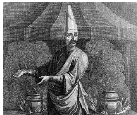
Рис. 1. Кухарський одяг минулих років

Варто зазначити, що до створення імперії Наполеона, як такого, одягу у кухарів не було. Він замінювався звичними штанами і сорочкою, які використовувалися в повсякденному житті. Для дівчат діяло подібне правило. Єдиним винятком ставав фартух для захисту від жиру і пара. Його використовували в усі часи.