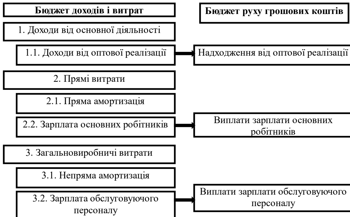
Рис. 3. Перенесення статей доходів і витрат бюджету доходів та витрат до бюджету руху грошових коштів

Визначення списку статей бюджету руху грошових коштів варто починати з повного копіювання всіх статей бюджету доходів та витрат, без деталізації на групи та підгрупи, без визначення нумерації статей бюджету руху грошових коштів. Групування статей бюджету руху грошових коштів варто почати з перейменування статей «Доходи...» на «Надходження...» і «Витрати...» – на «Виплати» (рисунок 3).