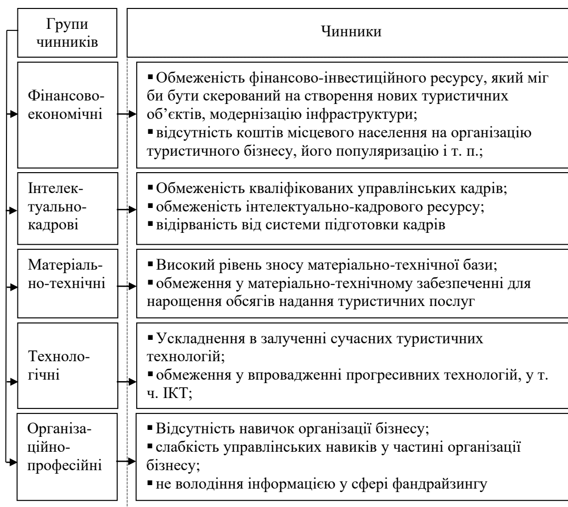
Рис. 1. Чинники, які перешкоджають розвитку зеленого туризму в Україні (до повномасштабної війни)

Однак, подальшій активізації та розвитку зеленого туризму в Україні перешкоджає низка чинників (рис. 1).