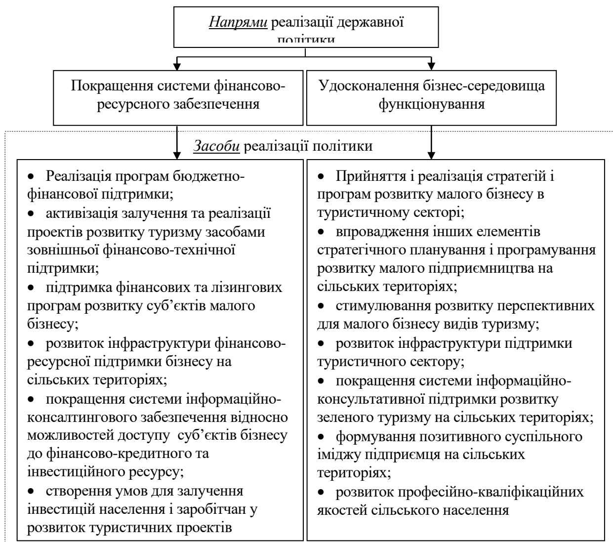
Рис. 3. Напрями та засоби державної політики реалізації потенціалу розвитку зеленого туризму в Україні