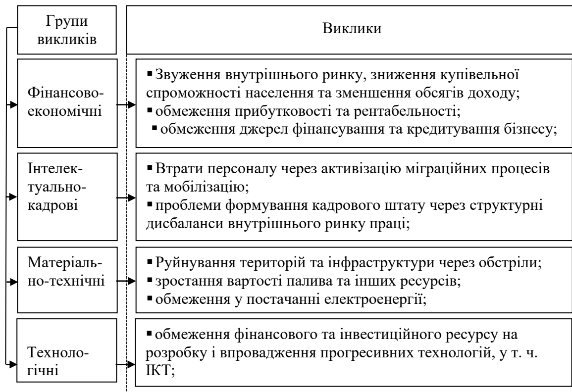
Рис. 2. Найбільш актуальні виклики функціонування та розвитку суб'єктів зеленого туризму України в умовах війни

процеси функціонування й розвитку вітчизняних суб'єктів, які спеціалізуються та/чи планували розпочинати свою діяльність у сфері зеленого туризму (рис. 2).