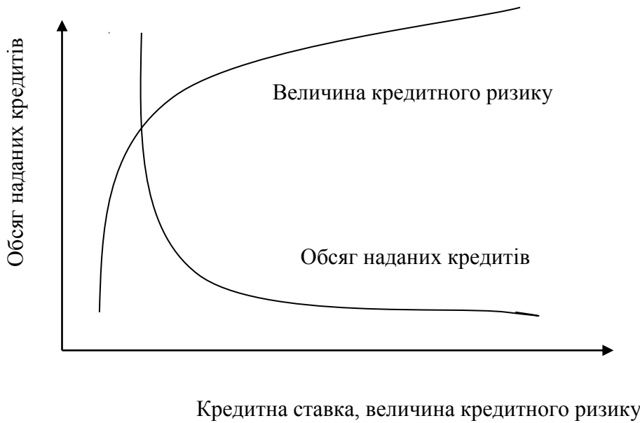
Рис. 2. Крива залежності кредитної ставки від величини наданих кредитів та кредитного ризику

визначається певним показником настання ризику, який може зростати (рис. 2).