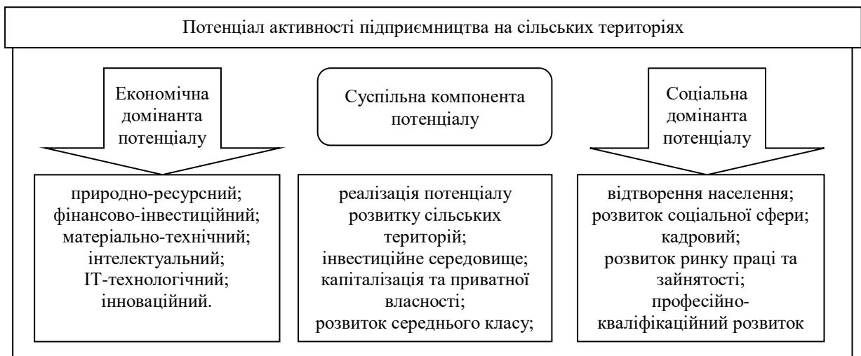
Рис. 3. Потенціал активності підприємництва на сільських територіях

Стан відтворення соціально-економічної домінанти розвитку підприємництва на сільських територіях під час воєнного стану в країні потребує системи організаційних, економічних, правових, управлінських і регулюючих дій, які мають впливати на показники діяльності суб'єктів-підприємців, що посилять потенціал їх активності з метою здійснення оцінки його стану та формування на цих засадах соціальної політики, що реалізується державною політикою стимулювання розвитку ринку праці в сільській місцевості (рис. 3).