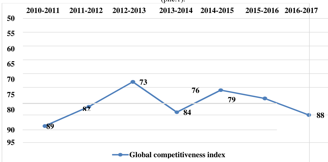
Рис.1. Динаміка змін позицій України в рейтингу за Індексом глобальної конкурентоспроможності 2010-2017 р.р. [14]

По-третє, за рівнем Глобального рейтингу конкуренції Україна посіла 88 місце (рис.1).