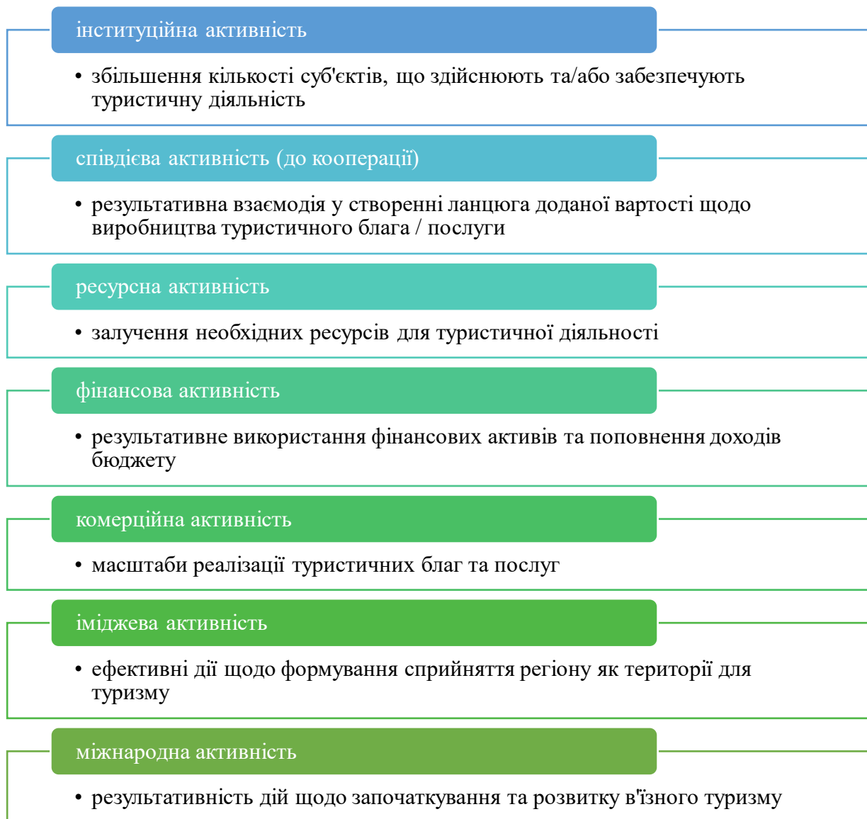
Рис. 1. Класифікація напрямів туристичної активності регіону

Авторське бачення напрямів туристичної активності регіону наведено на рисунку 1.