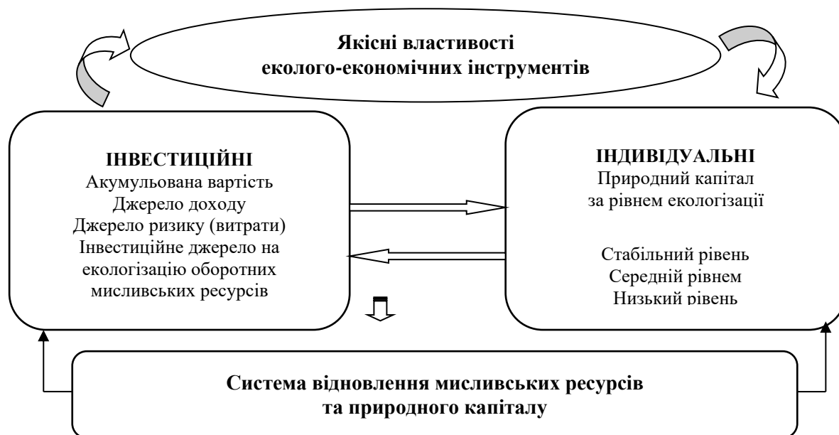
Рис. 2. Якісні властивості еколого-економічних інструментів в системі відновлення природного капіталу мисливських господарств

Система відновлення екологічної стійкості природного капіталу на засадах еколого-економічних інструментів має якісні властивості індивідуальної форми прояву (рис. 2).