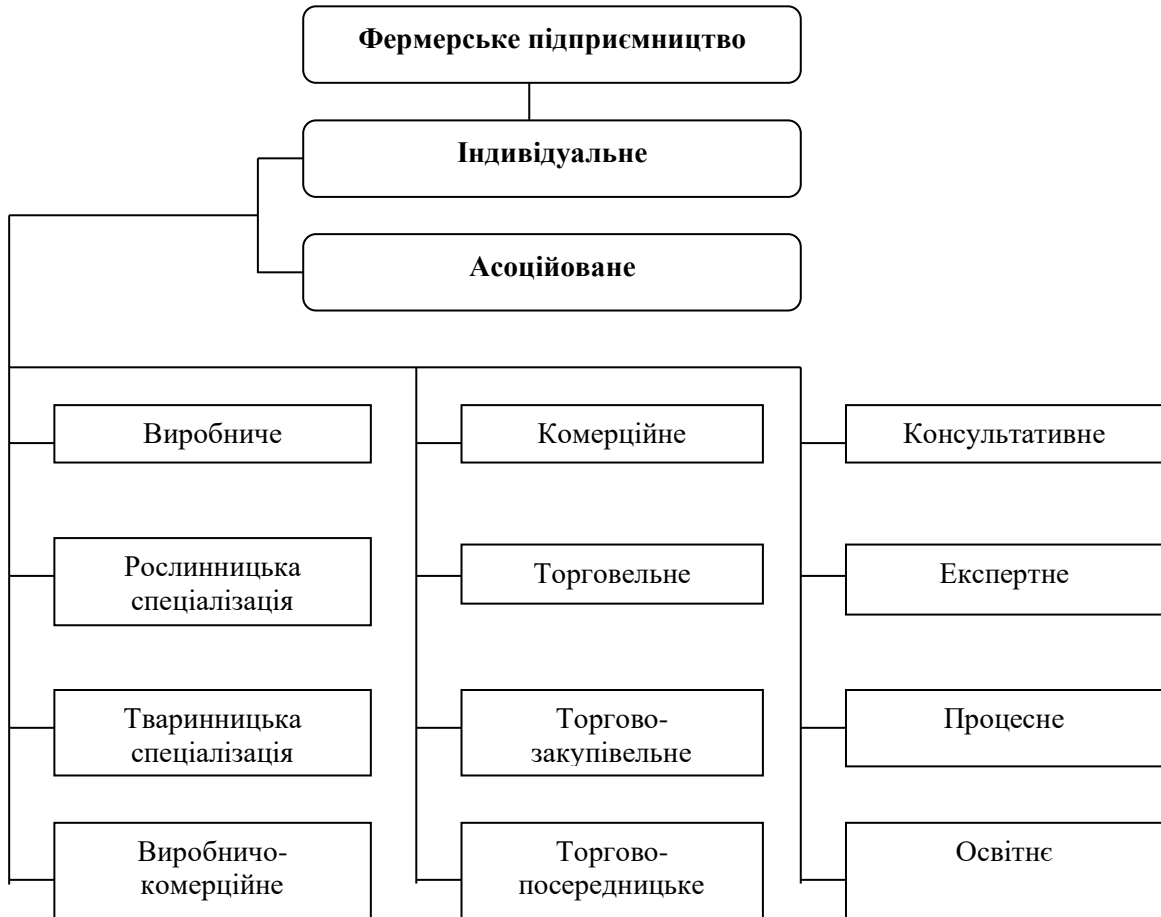
Рис. 1. Види фермерського підприємництва

за допомогою яких сільськогосподарська продукція аграрного походження сировина трансформується у перероблений