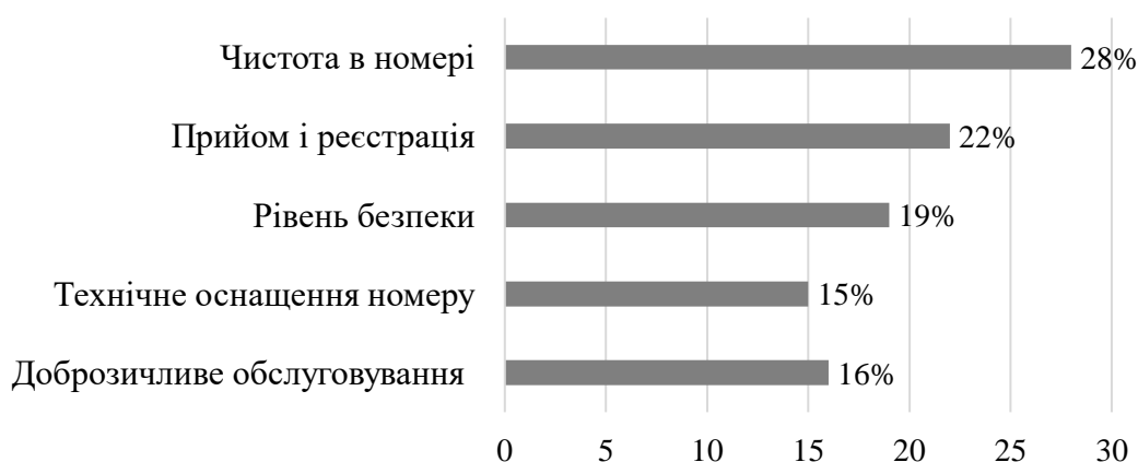
Рис. 2. Результати дослідження критеріїв якості послуг проживання, що надаються в готелях, %