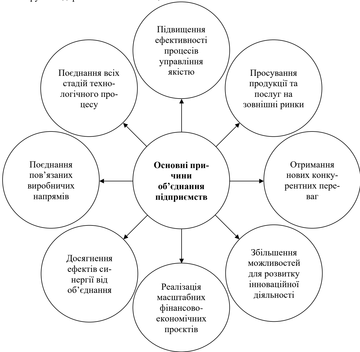
Рис. 1. Основні причини, що спонукають до ухвалення рішень про об'єднання підприємств Складено авторами на основі [2]

типу об'єднань є затвердження статуту, засновниками таких об'єднань вважаються власники або уповноважені державні органи і, на відміну від договірних об'єднань, учасники обмежені щодо права виходу з об'єднання.