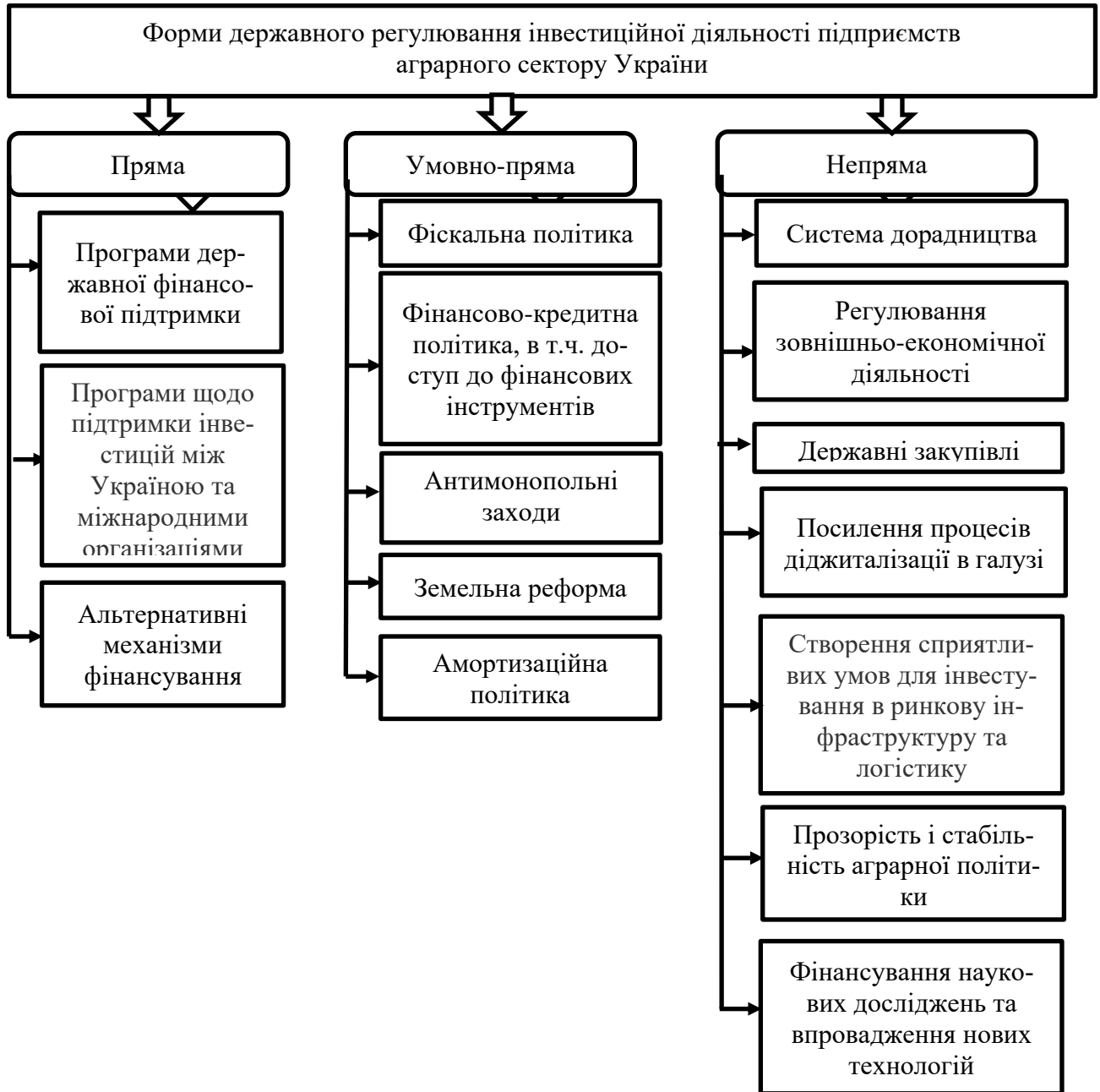
Рис. 1 Форми державного регулювання інвестиційної діяльності підприємств аграрного сектору України

Державне регулювання інвестиційних процесів передбачає фінансову підтримку діяльності як інвесторів, так і виробників сільськогосподарської продукції. Першочергово до неї відносять видатки на утримання загальнодержавних установ, які залучені до управління інвестиційним процесом і